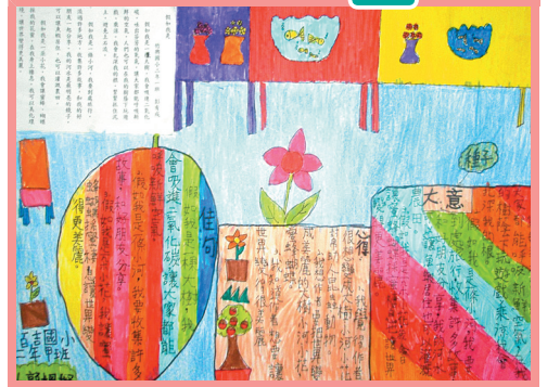
小朋友彩繪拼貼，呈現創意圖文。

一、與文章約會：請小朋友利用下課讀報，或晨讀十分鐘閱報，每週五選出一篇自己喜愛的文章，上臺朗讀佳句並和同學分享喜愛的理由。