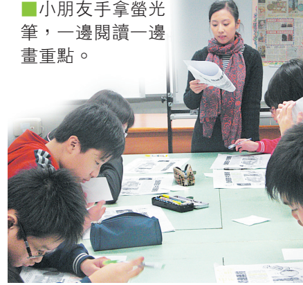
小朋友手拿螢光筆，一邊閱讀一邊畫重點。